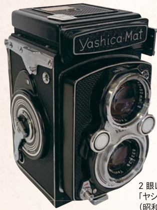
2眼レフカメラ 「ヤシカマット」 (昭和32年) 岡谷市所蔵