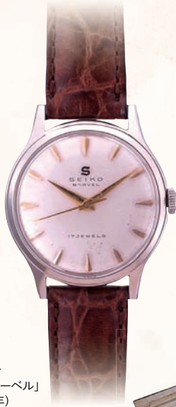
機械式時計 「セイコーマーベル」 (昭和31年)