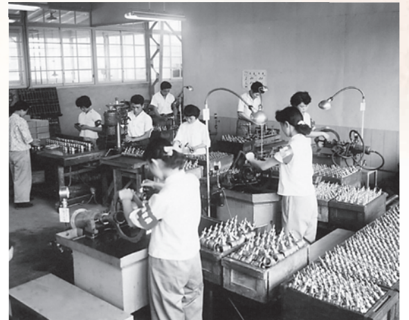
バルブ組立・検査作業(昭和20年代)