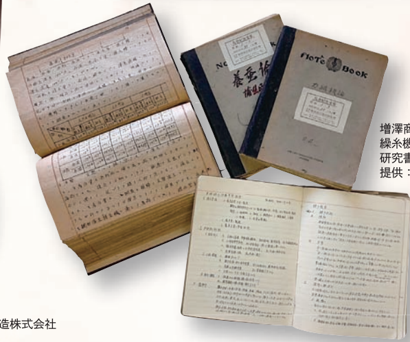
増澤商店 繰糸機設計図(昭和12年・上) 研究書類(左) 当館所蔵 提供：新増澤工業株式会社