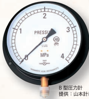
B型圧力計