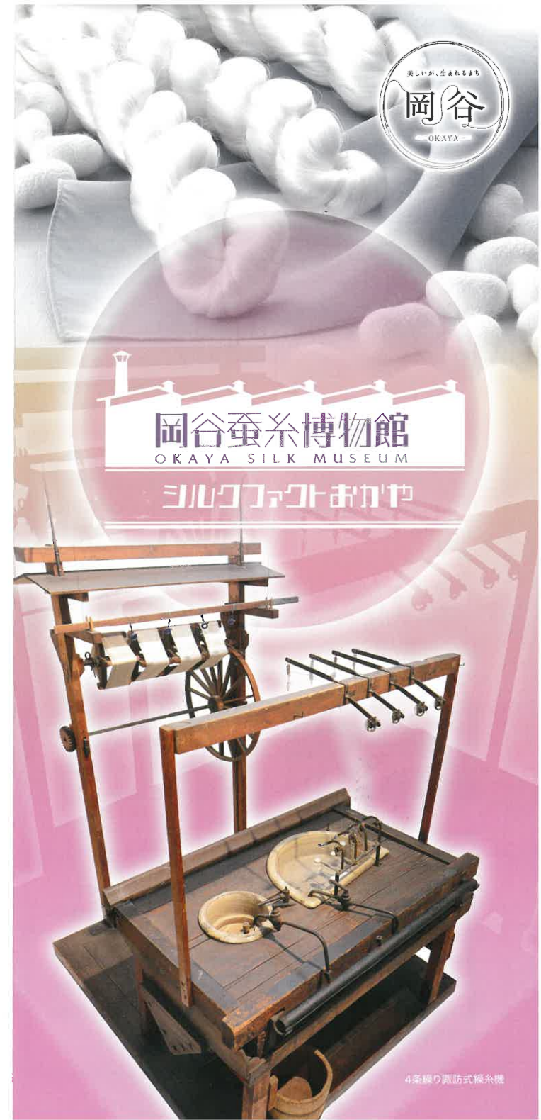
4条繰り諏訪式繰糸機

〒394-0021 長野県岡谷市郷田1-4-8 Tel.0266-23-3489 Fax.0266-22-3675 メールアドレス ☒ hakubtsukan@city.okaya.lg.jp ホームページ http://www.silkfact.jp/ シルクファクトおかや 検索