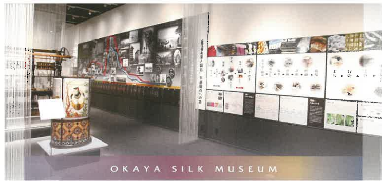
OKAYA SILK MUSEUM

明治時代初期、岡谷の人々はイタリア・フランスから導入された洋式製糸機械に創意工夫を重ねた諏訪式繰糸機を開発しました。その技術は全国に普及し、この地で生産された生糸の多くは輸出され、「シルク岡谷」としてその名を世界に轟かせるなど一大製糸業地に発展。日本の近代化に大きく貢献しました。