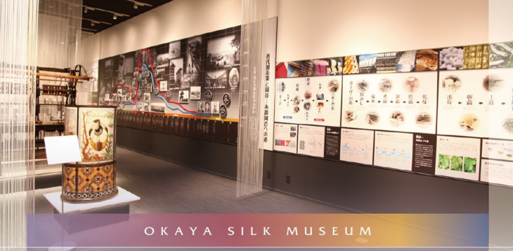
OKAYA SILK MUSEUM

明治時代初期、岡谷の人々はイタリア・フランスから導入された洋式製糸機械に創意工夫を重ねた諏訪式繰糸機を開発しました。その技術は全国に普及し、この地で生産された生糸の多くは輸出され、「シルク岡谷」としてその名を世界に轟かせるなど一大製糸業地に発展。日本の近代化に大きく貢献しました。