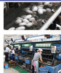
フランス式繰糸機