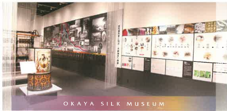
OKAYA SILK MUSEUM

明治時代初期、岡谷の人々はイタリア・フランスから導入された洋式製糸機械に創意工夫を重ねた諏訪式繰糸機を開発しました。その技術は全国に普及し、この地で生産された生糸の多くは輸出され、「シルク岡谷」としてその名を世界に轟かせるなど一大製糸業地に発展。日本の近代化に大きく貢献しました。