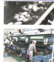
フランス式繰糸機