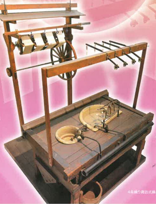
4糸繰り諏訪式繰糸機